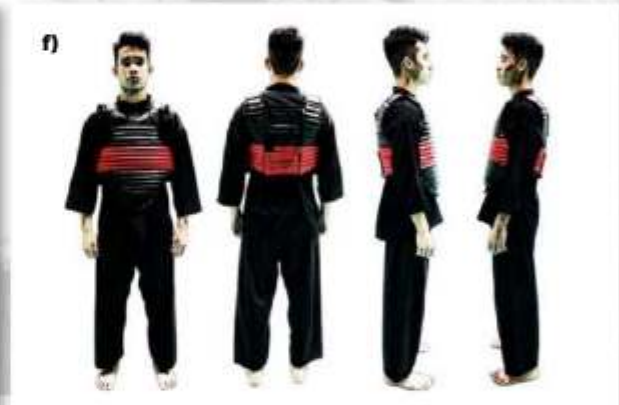
f) ATLET TANDING SUDUT MERAH