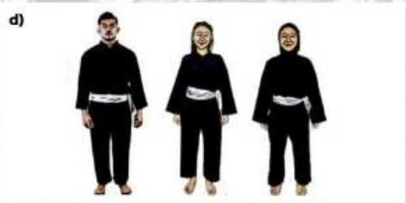
d) ATLET SENI BEREGU