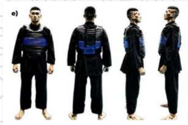
e) ATLET TANDING SUDUT BIRU