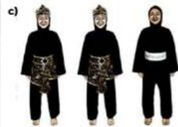
c) ATLET TGR PUTRI BERHIJAB