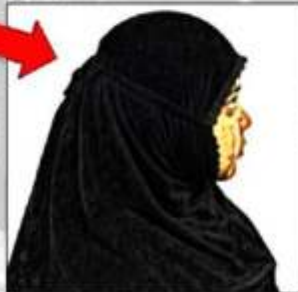
ATLET PUTRI BERHIJAB