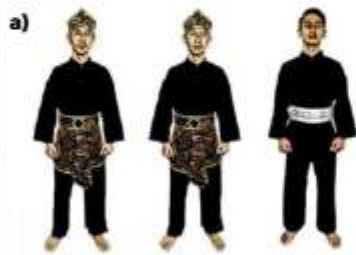
a) ATLET TGR PUTRA