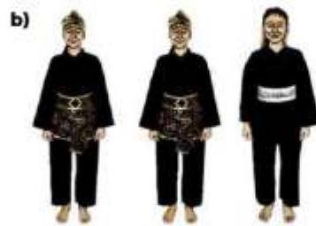
b) ATLET TGR PUTRI